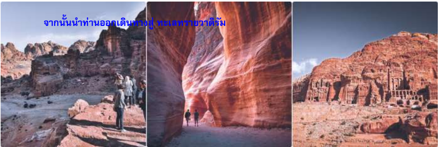
จากนั้นนำท่านออกเดินทางสู่ ทะเลทรายวาดีรัม

คำ รับประทานอาหารค่ำ ณ แคมป์ที่พัก ที่พัก LUXURY RUM MAGIC CAMP (BUBBLE TENT) หรือเทียบเท่า