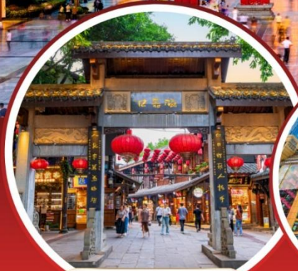
มหาศาลาประชาคม