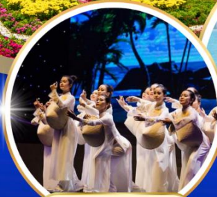
Charming Danang Show