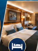
ห้องพัสดุหรู