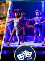
โชว์ระดับโลก