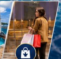
ช้อปปิ้งและ กิจกรรมอื่นๆ

รวมภาษี + ทิปบนเรือ + อาหารบนเรือทุกมื้อ