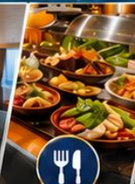
อาหารหลากหลาย