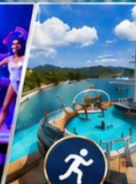
กิจกรรมมากมาย